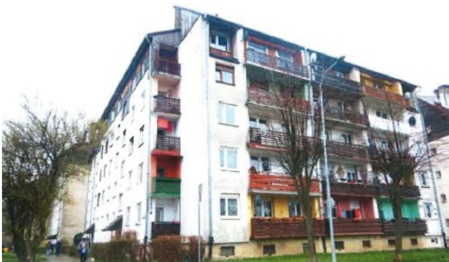
Ogólny widok budynku

na sprzedaż lokalu mieszkalnego Nr 4 znajdującego się w budynku położonym w Lubaniu przy ul. Lwóweckiej 20 wraz z udziałem we współwłasności nieruchomości gruntowej (działka nr 4/6, AM 9, Obręb III o powierzchni 205 m 2 , JG1L/00025801/6)